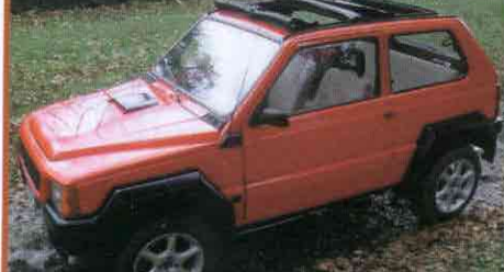
PANDA ROUGE: 1.300 CM 3 , 100 PK