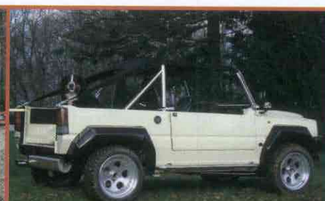
PANDA BAHYA: 999 CM 3 , 65 PK