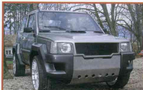
PANDA MAQUETTE: 1.300 CM 3 , 115 PK